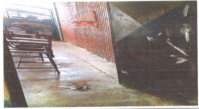
Foto 2: mantenimiento de las puertas lijado, cepillado y aplicación de pintura