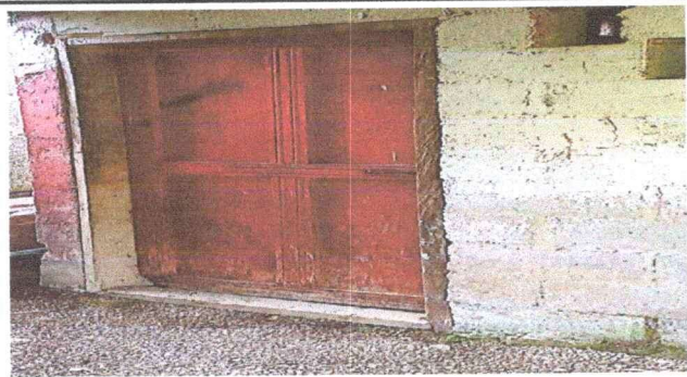
Foto1: Sustitución de puerta de madera a metal y sustitución de candado a chapa