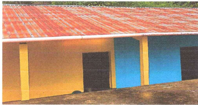
Foto1: Sustitución de laminas troqueladas a laminas troqueladas