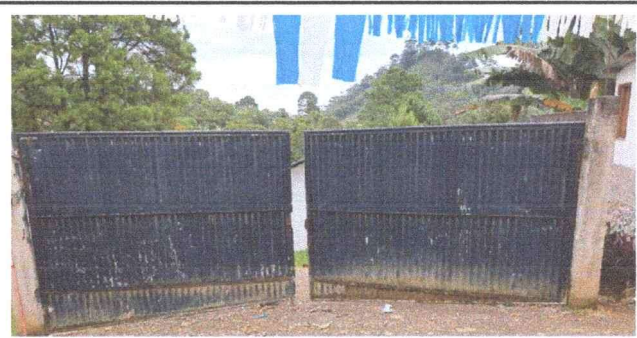
Foto 6: Mantenimiento a portones de metal, lijado y aplicación de pintura

Observación: Si es necesario se pueden agregar hojas adicionales y actualizar el número de hojas.