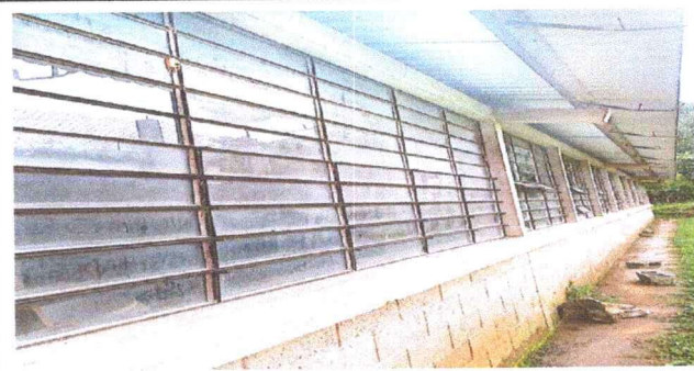
Foto 3: Mantenimiento lijado, cepillado de la estructura de metal de las ventanas