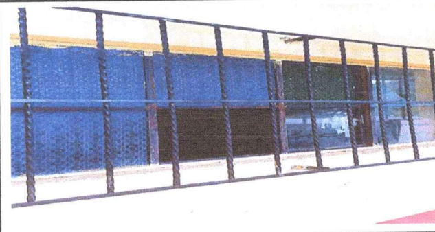
Foto 6: Mantenimiento de balcones de metal, lijado y aplicación de pintura

Observación: Si es necesario se pueden agregar hojas adicionales y actualizar el número de hojas.