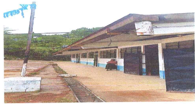
Foto 4: Mantenimiento de las puertas lijado, cepillado y aplicación de pintura