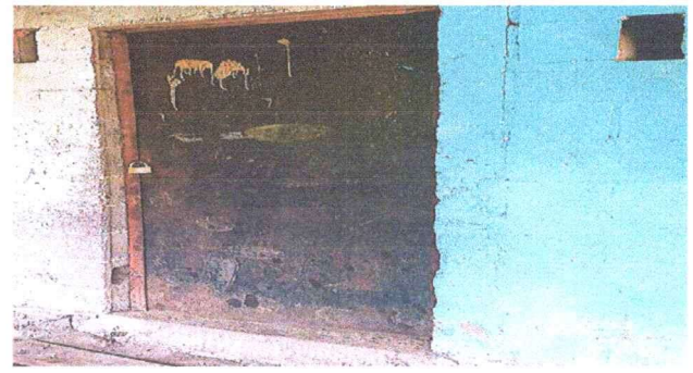
Foto 2: Mantenimiento de puerta lijado, cepillado y aplicación de pintura