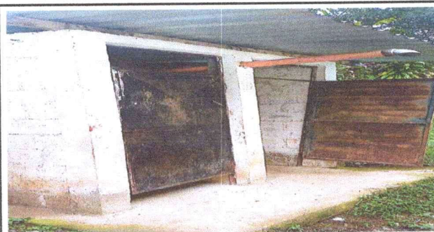
Foto 5: Reparación de la puerta cepillado, lijado y aplicación de pintura